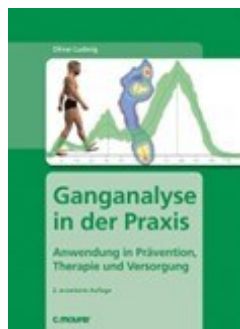
Ganganalyse in der Praxis

https://shop.maurer-fachmedien.de/orthopaedieschuhtechnik