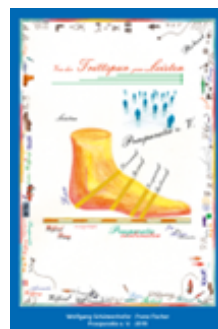
Von der Trittspur zum Leisten