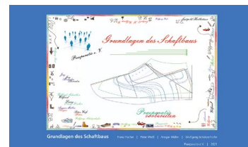
Grundlagen des Schaffbaus

Eine gute Möglichkeit zur Vorbereitung auf die Meisterprüfung: